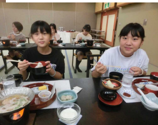
【朝食もおいしかった】