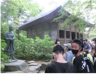
【中尊寺 松尾芭蕉の像】