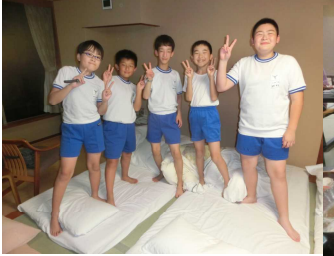
【ホテルの部屋でリラックス】