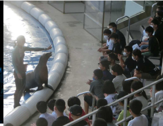
【アシカのパフォーマンス】